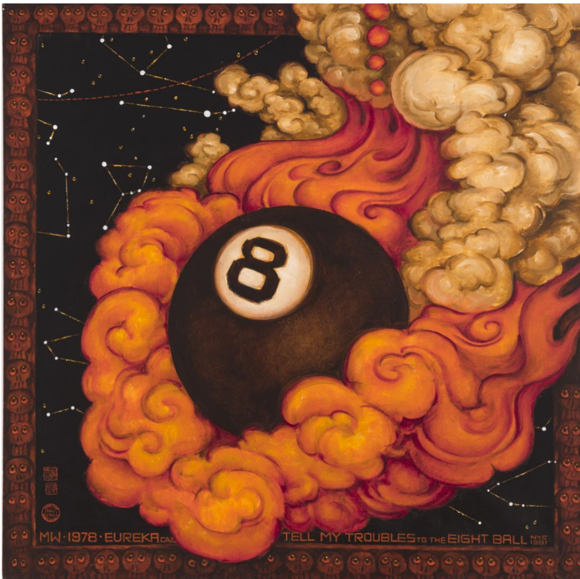
Martin Wong, Tell My Troubles to the Eight Ball (Eureka), 1978–81.