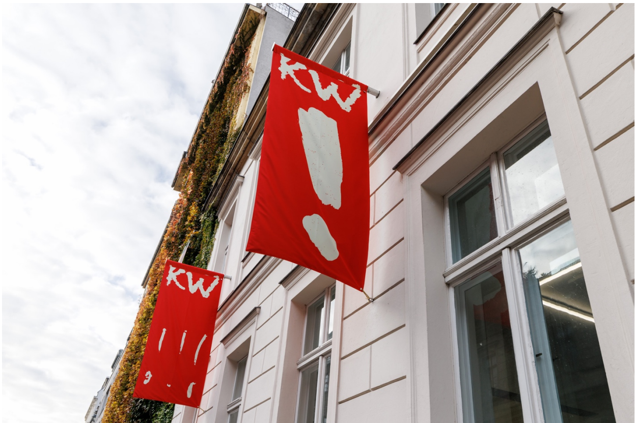
KW Institute for Contemporary Art, Berlin, 2025; Foto: Frank Sperling.