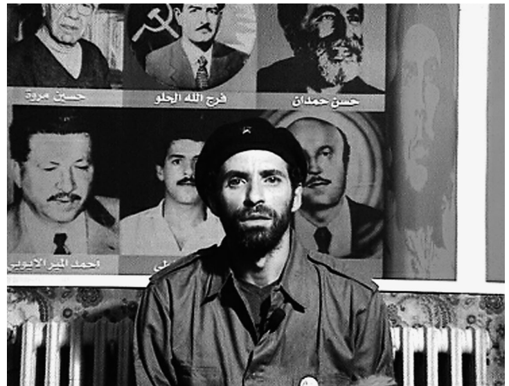
Elias Khoury und Rabih Mroué, Three Posters, 2000, Videostill der Performance.

1989 erwarb Mroué einen Abschluss in Theaterwissenschaften an der Libanesischen Universität in Beirut. Dort lernte er seine Lebensgefährtin Lina Majdalanie kennen, mit der er auch eng zusammenarbeitet. Mroué und Majdalanie haben mit ihren kritischen Untersuchungen und dem Einsatz von Theater- und Performancestrategien die Grenzen des libanesischen Theaters erweitert und es über seine traditionellen Räume hinaus zu einem konzeptuelleren Ausdruck gebracht, indem sie Aufführungen